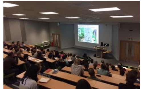
キューガーデンにおける講演