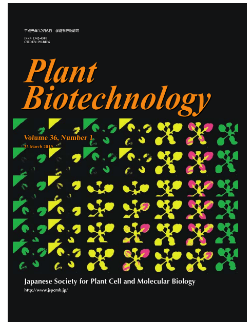
図4 個体レベルにおけるシグナルの定量メソッドの論文が Plant Biotechnology 誌の表紙に採用された。