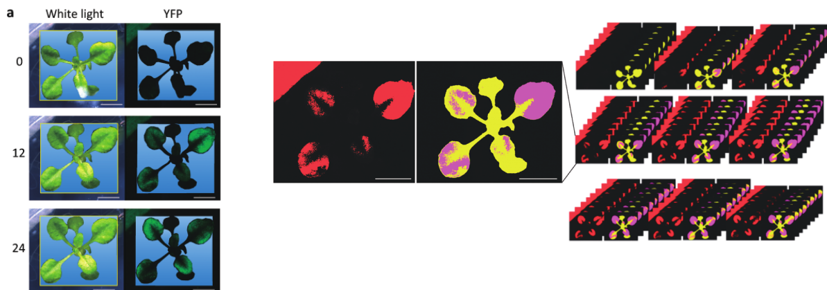
図3 植物の輪郭を認識することでバックグラウンドに由来するノイズを軽減し(左)、抽出した輪郭に特異的なシグナルを自動的に定量するメソッドである。(Kinoshita et al. 2019 より引用)

サンプルが任意の位置の選択はこれまで主にマニュアルで行われてきたが、長時間にわたるタイムラプス解析における動画には多数のフレームが含まれている。このため、マニュアルによるサンプルの輪郭の認識は労力・時間だけでなく、ヒューマンエラー・再現性という観点でも現実的ではない。本研究では、植物個体の輪郭を認識し、その上にシグナルを重ね合わせることでサンプルに特異的なシグナルのみを定量する手法を開発した。植物の輪郭の認識とシグナルを重ねる作業を自動的に行うため、労力・時間・再現性といった面で効率が良いメソッドである。この手法は、非侵襲的なイメージング法を用いたリアルタイム画像解析を定量的な解析へ広く応用することができる。蛍光・発光タンパク質を用いた遺伝子工学によって、細胞・組織と言ったマイクロなレベルでの分子的な動態が明らかになっているものの、個体が高次に協調して機能するマクロな生態系レベルでは遺伝子工学を用いたイメージング解析はほとんど皆無であった。我々は、遺伝子工学と非侵襲的な画像解析を組み合わせ、個体間におけるコミュニケーションを可視化するシステムを構築し、シームレスな自動定量法を開発した。物理的に固定されずに「ゆらゆらと動く植物」の輪郭を自動的に認識し、そこへ目的とする蛍光シグナルを重ね合わせるプログラミングを行うことで、タイムラプス解析における多数のフレームを一度に解析する。新しく考案された方法では、(1)物理的に植物を固定するといったバックグラウンド・ストレスによるノイズを軽減、(2)定量作業における労力・時間の削減、(3)マニュアル作業によるヒューマンエラーを減らすことができる手法である。