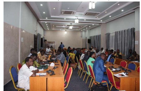
ブルキナファソ農業・環境省における講演