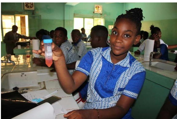
中学校における植物分子生物学のワークショップ 者)