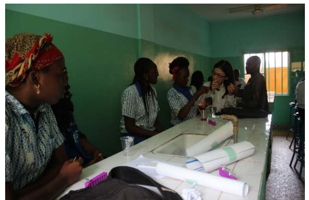
地元中学校におけるワークショップ(中央奥が筆者)